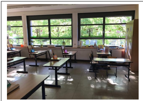
Sitzordnung in den Klassen

Vielfältige Vorbereitungsmaßnahmen finden zurzeit in der Schule statt und wir setzen nach dem Hygieneplan die geltenden Hygienemaßnahmen um.